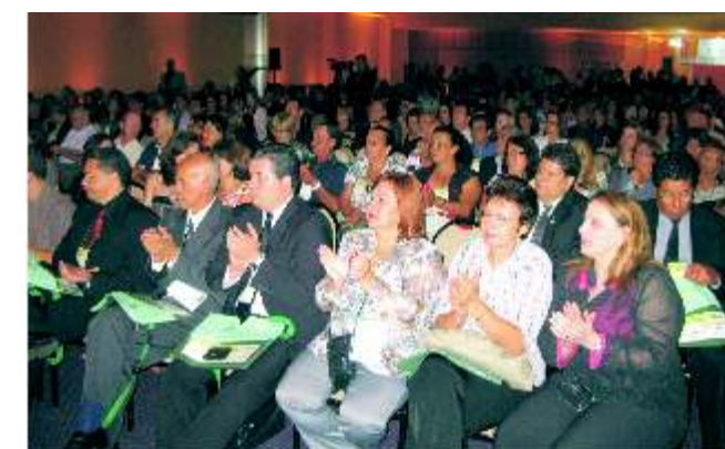
Mais de 500 pessoas participaram do congresso